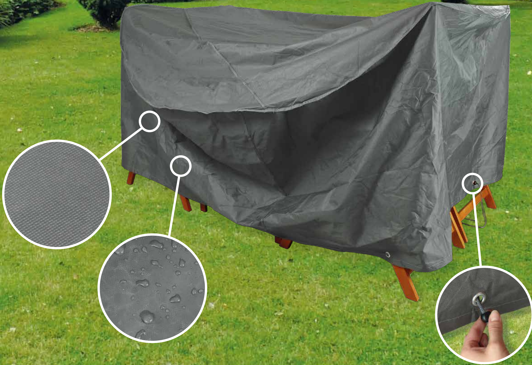
Schutzhüllen für Gartemöbel